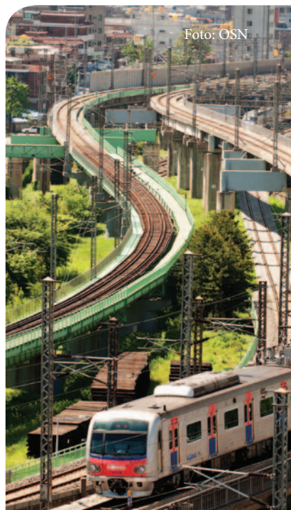
Železniční koridor v jihokorejském Soulu.