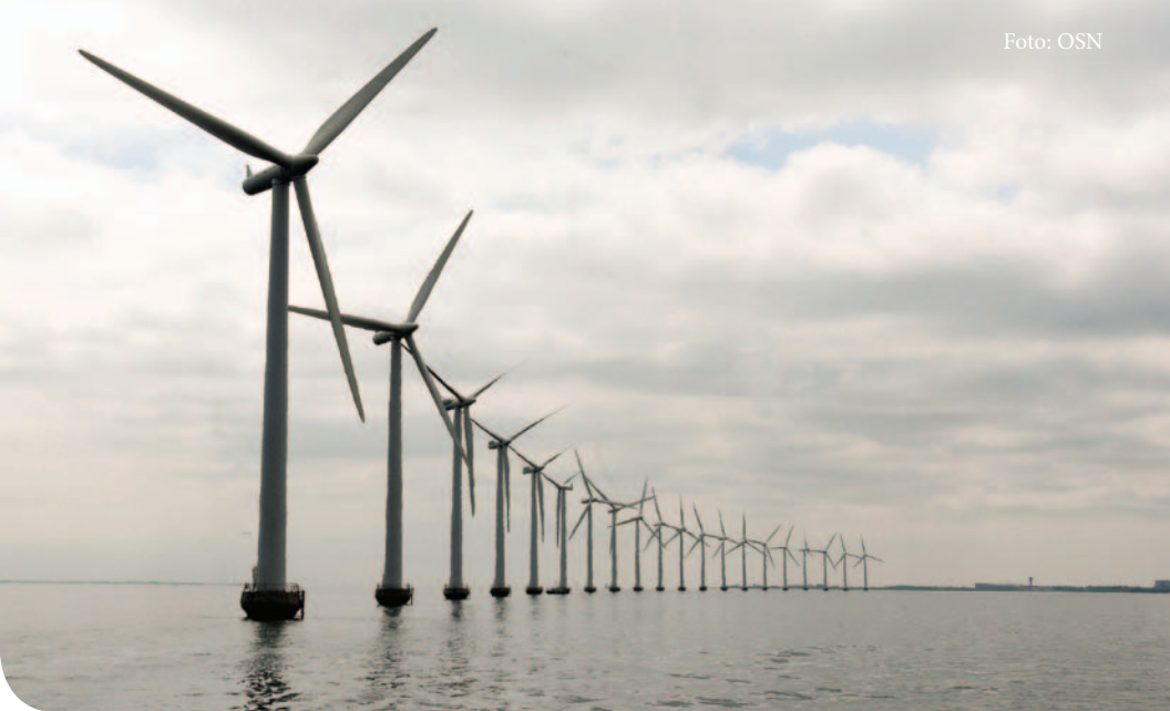
Větrná farma poblíž dánského pobřeží.