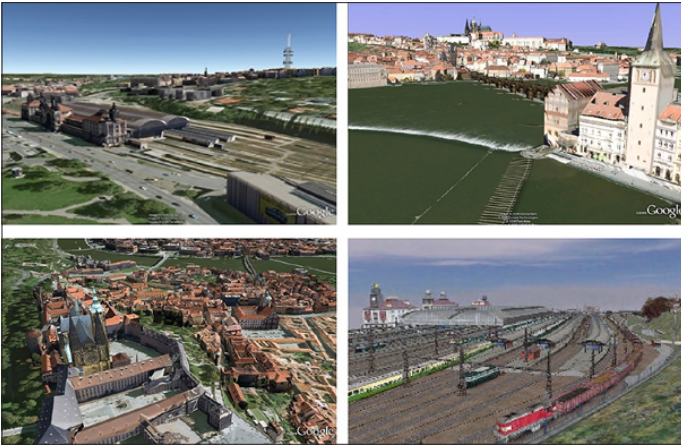
Obr. 4 Virtuální 3D model Prahy pro výzkum implementace smart technologií do ekosystému města